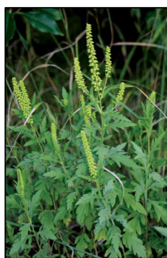
< En floraison

Épis de fleurs mâles qui produisent le pollen