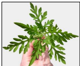
Herbe à poux en pré-floraison

L'association pulmonaire du Québec a lancé sa campagne de sensibilisation aux problèmes causés par cette plante.