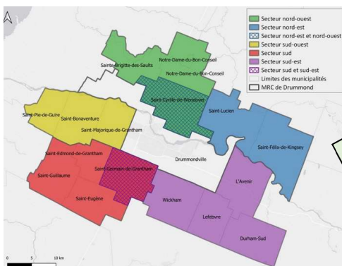
Carte des secteurs